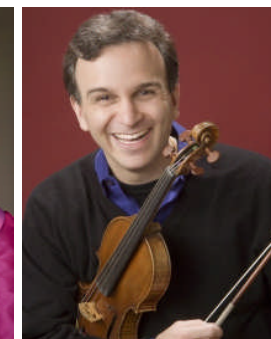
Pinchas Zukerman, Genia Kühmeier, Waltraud Meier, Gil Shaham